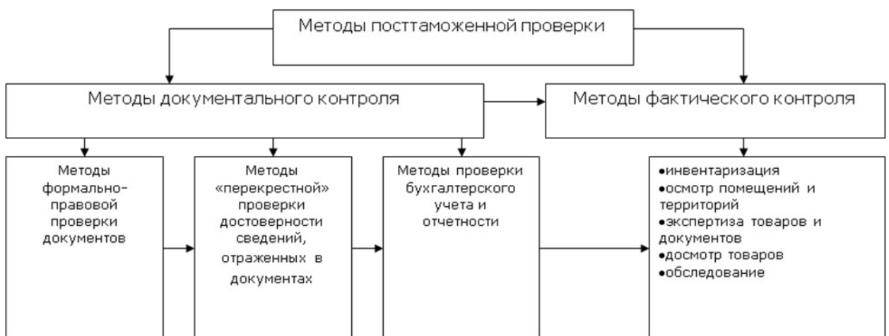
Рис. 5. Методы контроля.