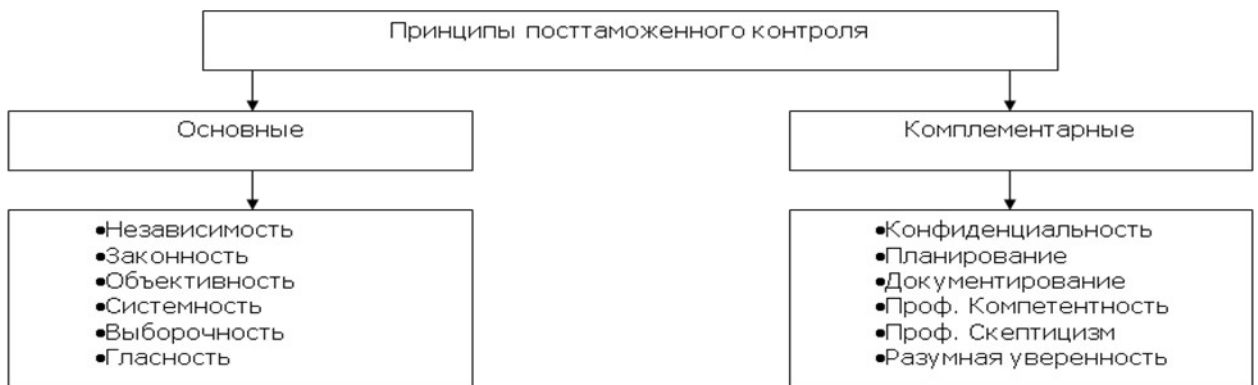
Рис. 4. Принципы посттаможенного контроля.