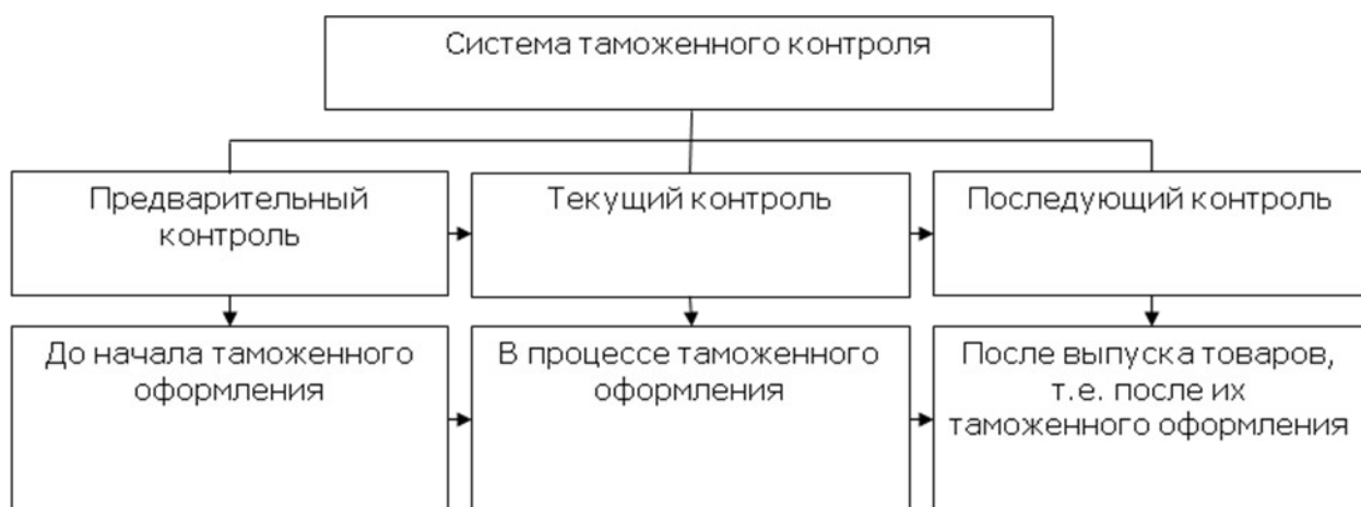
Рис. 1. Таможенный контроль.